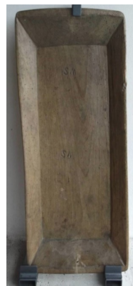
Ventilabro – capistiru (n. i. 55)