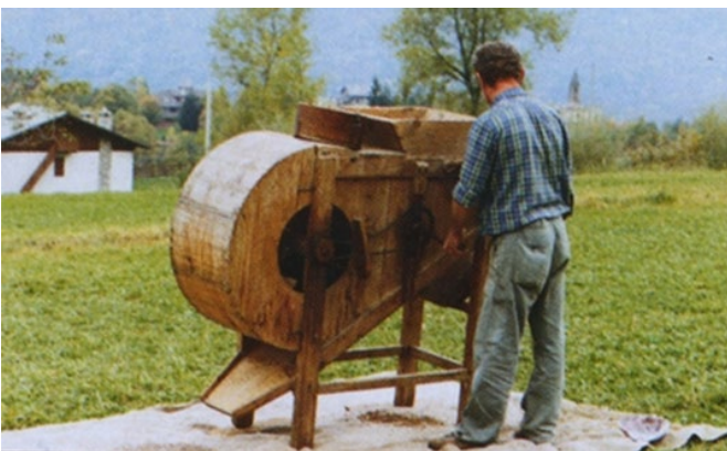
In Legno cm 23.5 (la) 125.4 (l)